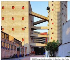
SESC Pompeia, obra de Lina Bo Bardi em São Paulo

Expressando o conforto restaurador, um sentimento nostálgico permeia a energia positiva das férias de verão. Traga referências vintage para um verão retrô — direção ainda essencial para a joalheria. Faça da cor o ponto central, priorizando uma paleta de tons ensolarados.