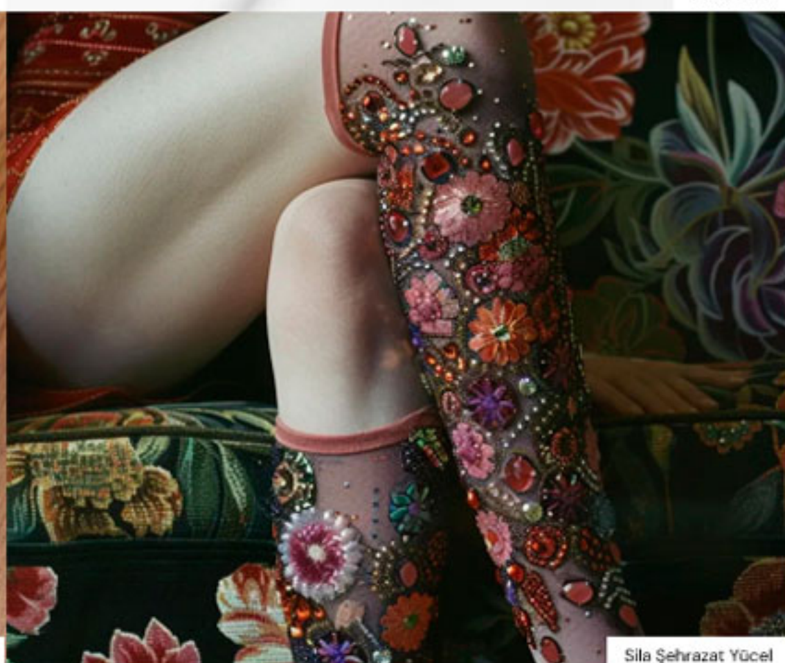
Sila Şehrazat Yücel